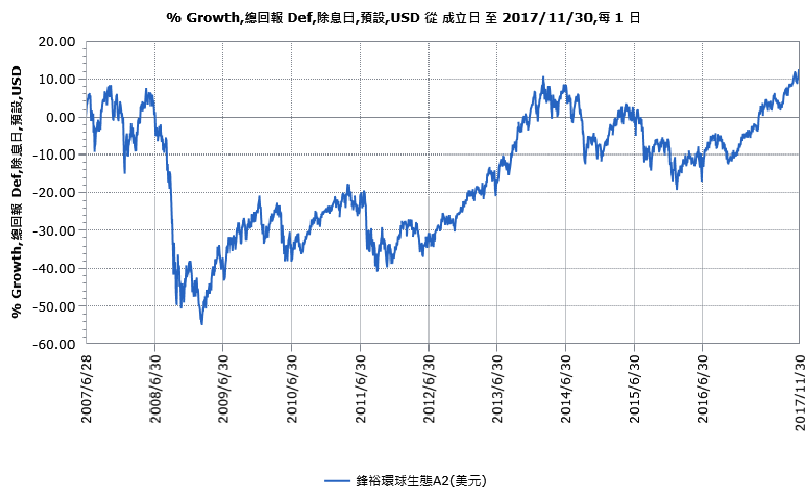
鋒裕基金 - 環球生態 A2,美元累積